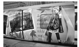
昨年、タイで初音ミクと札幌の写真デザインした電車を運行しました

札幌への観光客を増やすため、東京などの首都圏のほか、経済成長が著しいタイやインドネシアなどの東南アジアでも、札幌・北海道の魅力を伝える事業を行います。