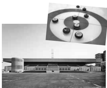
豊平区の月寒体育館を会場に行われます

来年3月に本市では初の開催となる世界選手権大会の運営費用を補助。札幌の国際的な知名度を高めるため、冬季スポーツの国際大会の誘致を進めます。