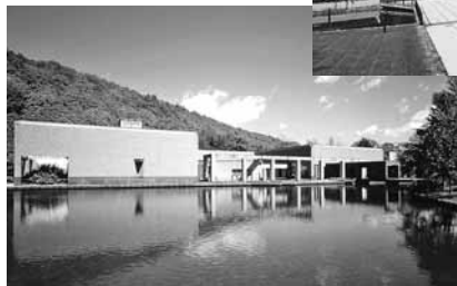
会場となる南区・芸術の森美術館(左)、中央区・道立近代美術館(上)