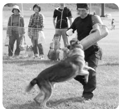
動物愛護フェスティバル▽

融雪機器などを設置する方へ 融雪機器などを設置し、その排水を公共下水道に流す場合には、事前に排水設備設置等確認申請書を提出してください。 問 排水指導課 ☎(818)3422