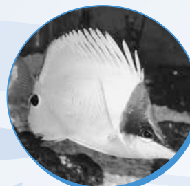
▲左が尾びれ、右が頭です