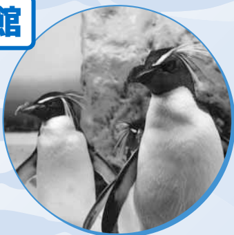
▲イワトビペンギン

アザラシやペンギンなど、 海や川にすむ約200種 の生き物が見られます。 カワウソと触れ合えるイ ベントが人気です。