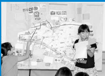
▲手稲西小学校の児童が、地域の危険な場所やすてきな場所をまとめた「地域紹介マップ」の発表会を行いました (7月17日)。