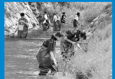
▲星置中学校の生徒が、多様な生物が生息する山口運河で生物観察会を行い、環境保全の大切さを学びました (7月26日)。

編集手稲区役所総務企画課広聴係 〒006-8612 札幌市手稲区前田1条11丁目 Tel:681-2432(直通) Fax:681-6639 ホームページ「ていねっていいね」 http://www.city.sapporo.jp/teine/