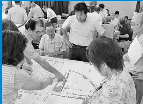
▲稲穂金山地区の住民らが、同地区オリジナルの避難所運営ゲームを用いて、災害時の避難所運営を模擬体験しました (8月7日)。