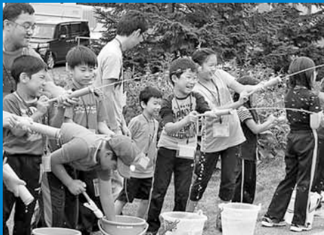
▲「手稲わくわく探検隊」が開催され、14組36人の親子が星置川探索や工作などを通して自然とのふれあいを楽しみました (8月3日)。