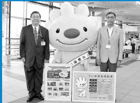
▲JR手稲駅自由通路「あいくる」で、区マスコットキャラクター「ていね」のフレーム切手発売記念イベントが開催されました (7月23日)。