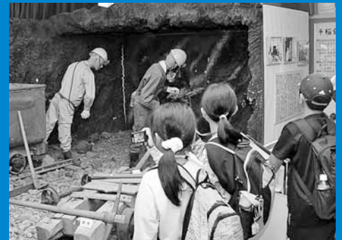
▲区内の史跡などを巡るバスツアーが開催され、小学生38人が手稲の文化や歴史への理解を深めました (7月29日)。