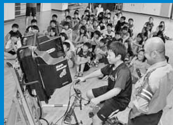
▲富丘小学校と稲積小学校で自転車安全教室が開催され、児童はシミュレーターを使い交通ルールを学びました (7月19日)。