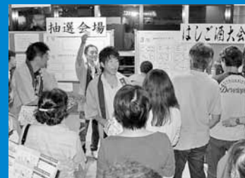
▲JR手稲駅南口周辺の居酒屋やスナックなどを巡る「第10回手稲はしご酒大会」が開催されました (7月19日)。