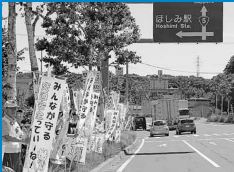
▲手稲区と小樽市を結ぶ国道5号沿いの市境界付近で、2市合同の交通安全街頭啓発が行われました (7月18日)。

人口140,480人 (前月比+3) 世帯数57,246世帯 (前月比+37) 平成25年8月1日現在