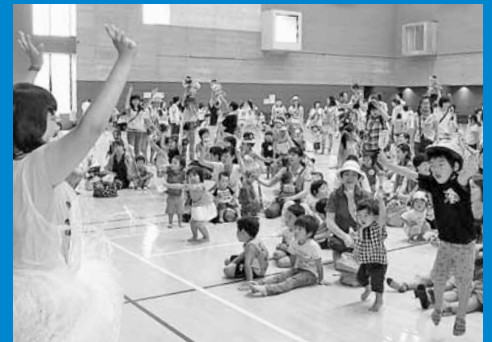
▲北海道工業大学で「手稲はわふる☆きっずらんど」が開催され、約600人の親子連れが多彩な遊びを楽しみました (8月8日)。