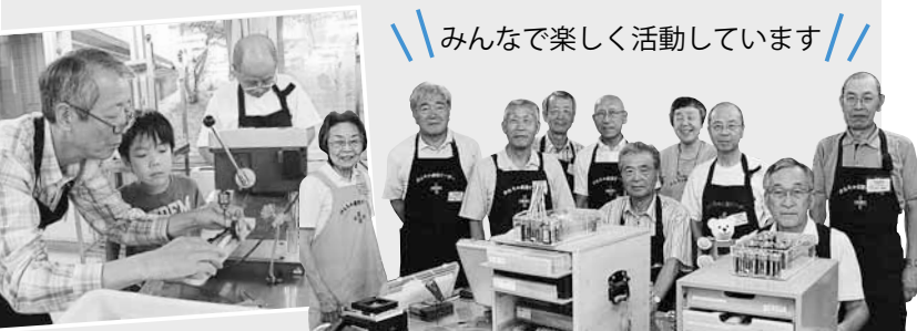
\\ みんなで楽しく活動しています //

それぞれの得意分野を生かし、修理を行います。最近では、電気製品の困り事相談を受けることも。私たちの活動が、親子の会話を生んだり、絆を育む場として役立ったりしていると感じ、とてもやりがいがあります。皆さんの喜ぶ顔を見るのが何よりうれしいです。