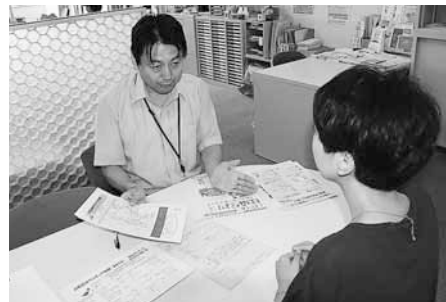
▲白石区社会福祉協議会

所在地 中央区北1条西9丁目(リンケージプラザ内) ☎219-1737 FAX 261-8881