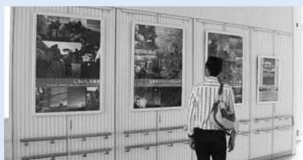
申込先・詳細 区地域振興課 ☎861-2422

JR白石駅自由通路の壁面に、地域の市民活動団体が主催するイベントなどのポスターを無料で掲示できるようになりました。ぜひご利用ください。 ※利用条件などの詳細は区地域振興課にお問い合わせを。