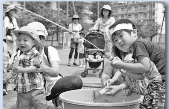
ヨーヨー 7/30 Go!Go! きたっこ夏まつり ～白楊小学校

編集 北区市民部総務企画課広聴係 〒001-8612 北区北24条西6丁目 ☎ 757-2503 FAX 757-2401