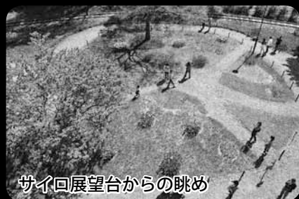
サイ回展望台からの眺め

「リリトレ」の駅舎内で、北区産の食材を紹介するイベントを企画しています! ミニコンサートも開催予定♪ 詳しくは、来月(10月)号の情報プラザをご確認ください。