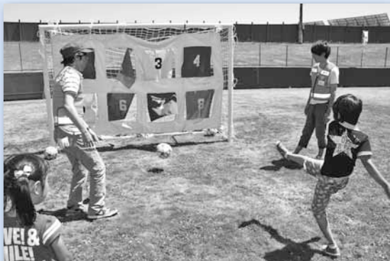
7/21 あさぶ三世代げんき広場 ～麻生球場