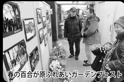
春の百合が原ふれあいガーデンフェスト