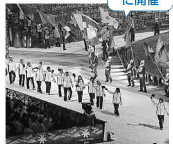
23年にカザフスタンで行われた第7回大会の開会式

第8回アジア冬季競技大会に向けて本格的に準備を開始。大会の広報活動を行うとともに、各競技団体などと大会運営方法の協議を進めます。