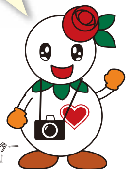
マスコットキャラクター「しろっぴー」

区内で撮影した風景写真を随時募集しています。ご応募いただいた写真は、広報さっぽろ区民のページや区役所ホームページなどで紹介します。募集要項は、区総務企画課広聴係と区内各まちづくりセンターで配布しているほか、区役所ホームページに掲載しています。