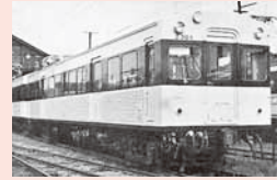
大正7年から昭和44年まで、この路線は運行されていました。