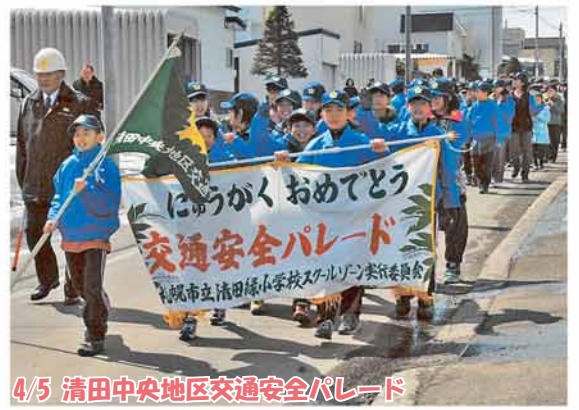
4/5 清田中央地区交通安全パレード

清田緑小学校と清田南小学校の児童が旗を先頭に通学路を行進！交通安全を元気に呼び掛けました。