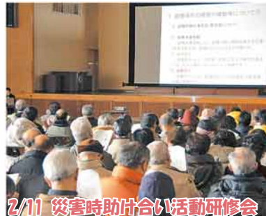
2/11 災害時助け合い活動研修会