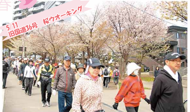
5/11 旧国道36号 桜ウオーキング

きれいな川であり続けるようお願いながら、北野ふれあい橋のたもとで約2万匹の稚魚を放流しました。