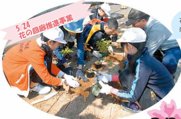
5/24 花の回廊推進事業