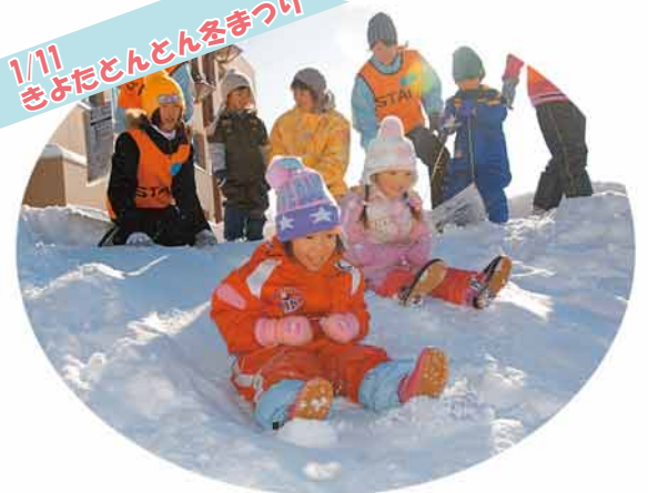
1/11 きよたどんとん冬まつり