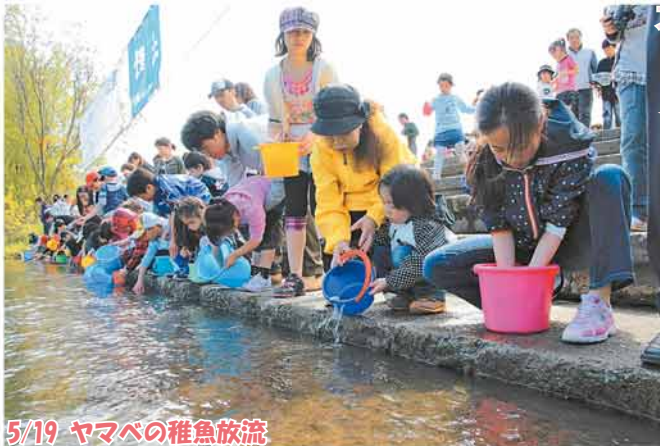
5/19 ヤマベの稚魚放流

清田緑小学校と清田南小学校の児童が旗を先頭に通学路を行進！交通安全を元気に呼び掛けました。