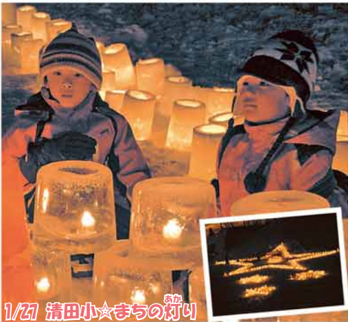
1/27 清田小★まちの灯り