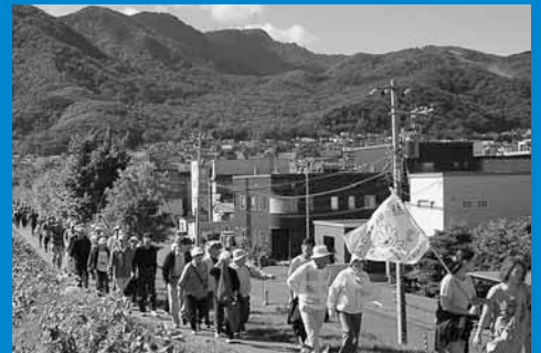
▲中の川桜づつみを歩こう会が開催され、地域住民ら約290人が爽やかな秋風を感じながらウォーキングを楽しみました (10月8日)。