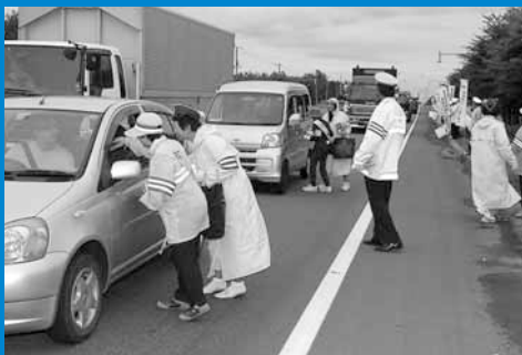
▲秋の交通安全市民総ぐるみ運動に合わせて、国道337号で小樽市、石狩市、手稲区の3市合同の交通安全街頭啓発が行われました (9月25日)。