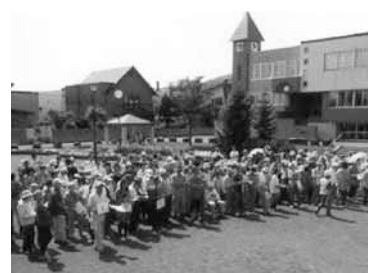
▲290人が参加した避難訓練