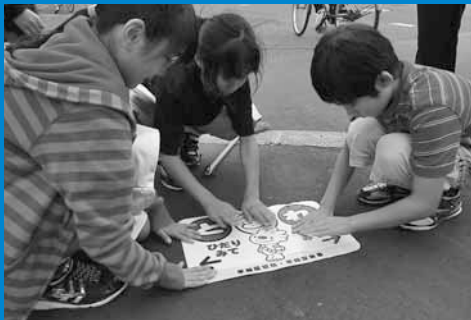
▲稲積小学校の児童らが、道路への飛び出し注意を促すステッカーをスクールゾーン区域内の歩道に貼り付けました (9月27日)。

人口140,422人 (前月比+45) 世帯数56,733世帯 (前月比+49) 平成24年10月1日現在