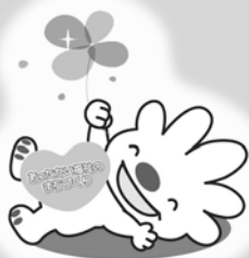
▲最優秀賞に選ばれた作品