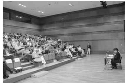
▲高齢者や障がい者への適切な対応を学んだ民生委員・児童委員全体研修会

訪問活動の際に心掛けているのは、初対面のうちからいきなり細かいことを聞くのではなく、根気強く訪問の数を重ね、相手の方と自然と打ち解けること。そうすれば、多くの方が心を開き、いろいろなことを話してくれるようになります。見守り活動で大切なのは、時間をかけてでも互いの信頼関係を築くことだと思います。そうした努力の積み重ねが、いざというときに役に立ちます。援助を必要とする人が、適切なサービスを受けられるよう、地域包括支援センターや介護予防センターなど専門機関と連携を取りながら、より質の高い活動を目指していきたいと考えています。