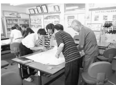
▲マップづくりの様子