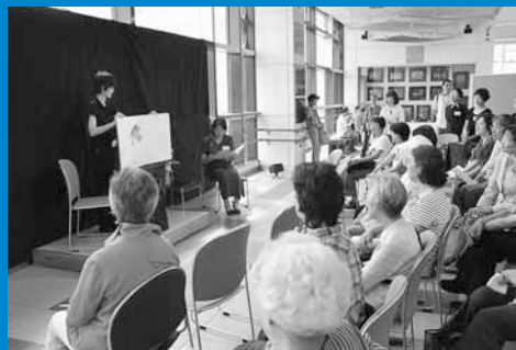
▲JR手稲駅自由通路「あいくる」で、おとなが絵本をたのしみ会「ひさの星」による絵本の朗読会が行われました (9月19日)。