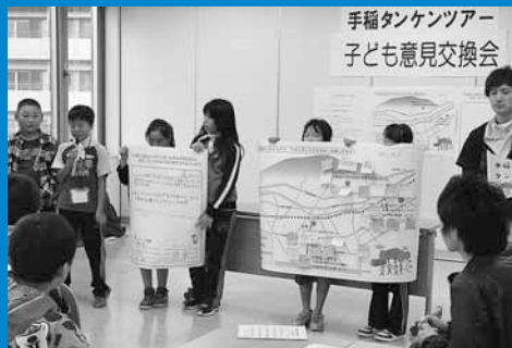
▲手稲タンケンツアーが行われ、区内の小学生が手稲の歴史や未来について学び、手稲のまちについて意見交換を行いました (10月7日)。