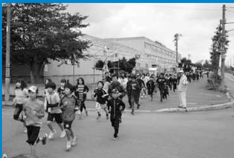
▲津波に対する災害対応力を高めるため、手稲北小学校と地元の星置連合町内会が合同で避難訓練を行いました (10月1日)。