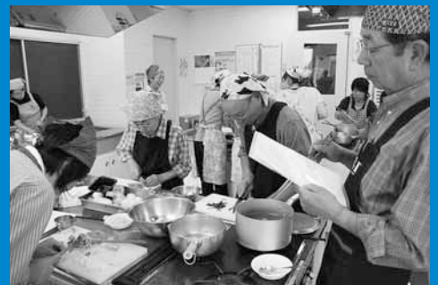
▲区民センターで「さっぼる食スタイル」を学ぶ料理講習会が開催され、23人の区民が参加しました (9月28日)。

編集手稲区役所総務企画課広聴係 〒006-8612 札幌市手稲区前田1条11丁目 Tel:681-2432 (直通) Fax:681-6639 ホームページ「ていねっていいね」 http://www.city.sapporo.jp/teine/