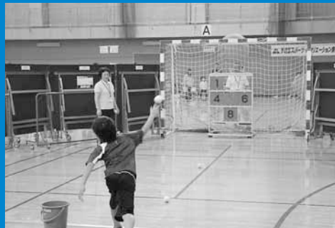
▲手稲区体育館で手稲区スポーツ・レクリエーション祭2012が開催され、多くの参加者がスポーツの秋を楽しみました (9月30日)。