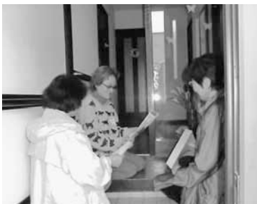
▲見守り・安否確認の様子

平成22年から、65歳以上の一人暮らしの方を対象に、見守り・安否確認を行っています。現在の対象者は27人。協力員が、2人1組で月1回訪問しています。活動の上で大切なのは、町内全体に活動の必要性を理解してもらい、隣同士で見守ろうという雰囲気をつくること。この点は根気強く呼び掛けていきます。今取り掛かろうとしているのは、地域福祉マップの作成。先進事例などを参考にしながら、災害時も見据え、互いの情報共有に役立つマップづくりができればと考えています。