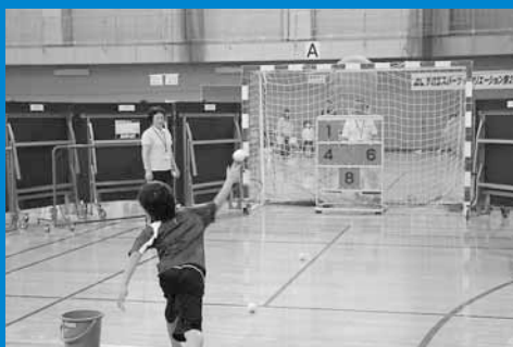
▲手稲区体育館で手稲区スポーツ・レクリエーション祭2012が開催され、多くの参加者がスポーツの秋を楽しみました (9月30日)。