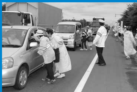
▲秋の交通安全市民総ぐるみ運動に合わせて、国道337号で小樽市、石狩市、手稲区の3市合同の交通安全街頭啓発が行われました (9月25日)。