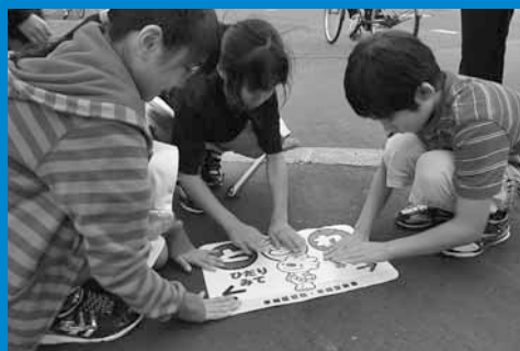
▲稲積小学校の児童らが、道路への飛び出し注意を促すステッカーをスクールゾーン区域内の歩道に貼り付けました (9月27日)。

人口140,422人 (前月比+45) 世帯数56,733世帯 (前月比+49) 平成24年10月1日現在