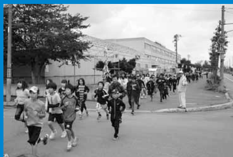
▲津波に対する災害対応力を高めるため、手稲北小学校と地元の星置連合町内会が合同で避難訓練を行いました (10月1日)。