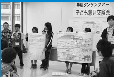
▲手稲タンケンツアールが行われ、区内の小学生が手稲の歴史や未来について学び、手稲のまちについて意見交換を行いました (10月7日)。