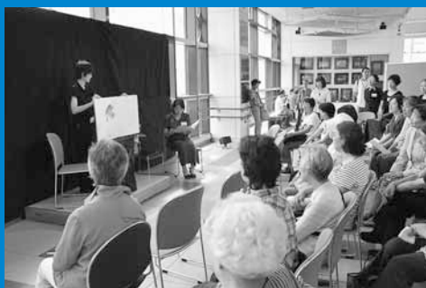
▲JR手稲駅自由通路「あいくる」で、おとなが絵本をたのしみ会「ひさの星」による絵本の朗読会が行われました (9月19日)。