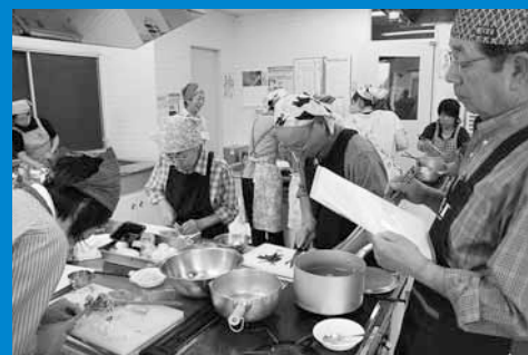
▲区民センターで「さっぽろ食スタイル」を学ぶ料理講習会が開催され、23人の区民が参加しました (9月28日)。

編集手稲区役所総務企画課広聴係 〒006-8612 札幌市手稲区前田1条11丁目 Tel:681-2432 (直通) Fax:681-6639 ホームページ「ていねっていいね」 http://www.city.sapporo.jp/teine/