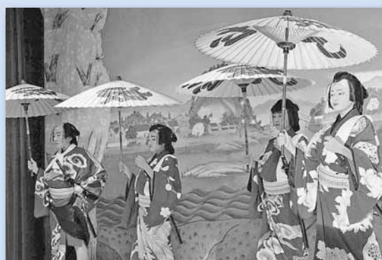
10/5 新琴似歌舞伎公開講座 ～プラザ新琴似

北区 HP 「みてきて北区」 ◆ http://www.city.sapporo.jp/kitaku/ Eメール ◆ ki.somu@city.sapporo.jp