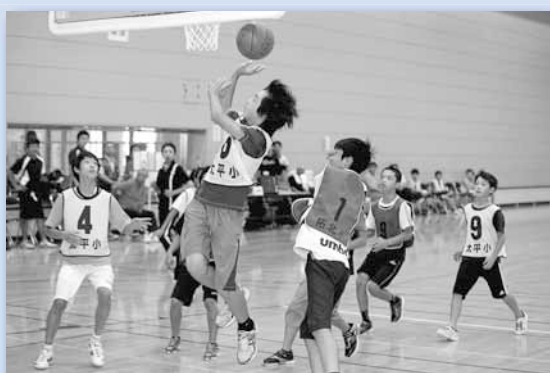
9/23 北区少年少女スポーツ大会 ～北区体育館