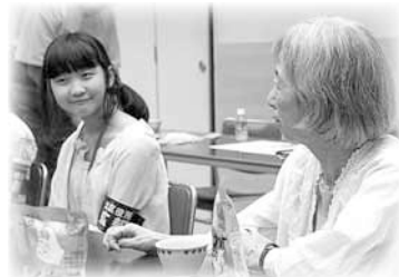
一緒にお茶を飲みながら話を聞くことも記者のお仕事(^^)

参加者の一人は「家に一人でいると寂しいけれど、ここに来るとみんなと会って楽しく過ごせます」と、話してくれました。家に閉じこもらずに、たくさんの人と交流することが、介護予防につながっています。今後は、季節ごとのイベントも考えているそうです。