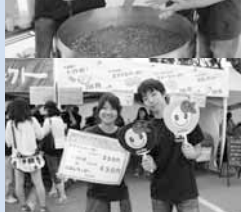
▲若者プロジェクト