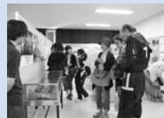
▲しろいしものしり博士展