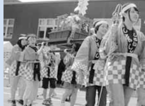
▲子どもみてし(子ども遊具カーニバル)