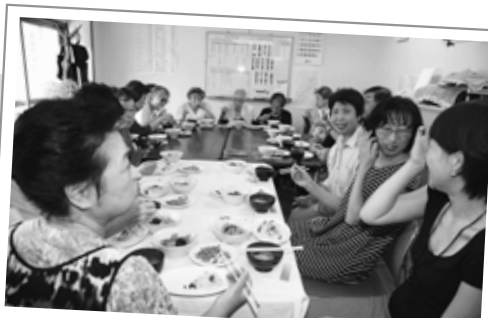
にぎやかにお昼を楽しむ「たんぽぽ」の皆さん