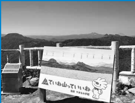
▲写真上：「手稲山ウオーキング」が開催され、171人の区民が参加しました（7月8日）。 写真下：6月から山頂に設置された手稲山の南西に広がる山々の案内板。