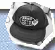
▲みどりのサポーターがかぶっている帽子