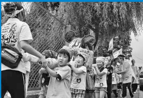
▲ちあふる・ていねと手稲中央幼稚園の園児らによる「こどもみこし」が行われ、元気な掛け声が辺りに響いていました（7月10日）。