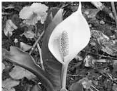
▲真っ白な仏炎苞(葉が変形したもの)が印象的なミスバシヨウ