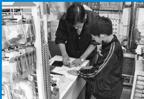
▲稲穂小学校と手稲西小学校の児童ら171人が「子ども110番の家」を回るスタンプラリーに参加しました（6月23日）。