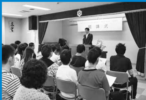
▲知的障がいのある方を対象としたホームヘルパー2級養成講座の開講式が、手稲老人福祉センターで行われました（7月7日）。