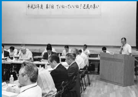
▲平成24年度第1回「ていねっていいね! 区民の集い」が開催されました（6月29日）。