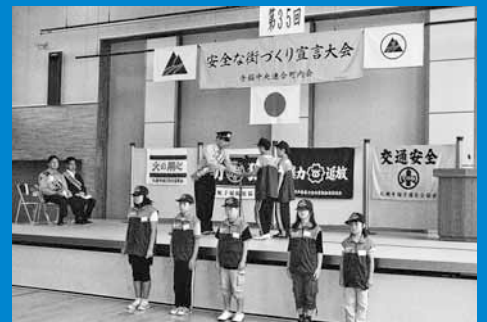
▲手稲中央連合町内会が手稲コミュニティセンターで「第35回安全な街づくり宣言大会」を開催しました（7月7日）。