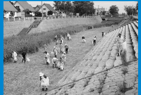
▲手稲土川川で手稲鉄北まちづくり協議会による美化活動が行われました（7月7日）。