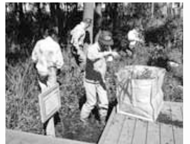
▲アシの抜き取り作業の様子

討が行われ、翌17年からスタート。当初は東側にアシ、西側にササが密生し、他の植物を追いやり、見通しの悪い状態となっていました。アシ、ササを刈り取ることで、陰に隠れていた植物に日が当たって元気になるため、四季折々の植物を観察できるようにになりました。また、見通しが良くなり、防犯面での改善にもつながっています。