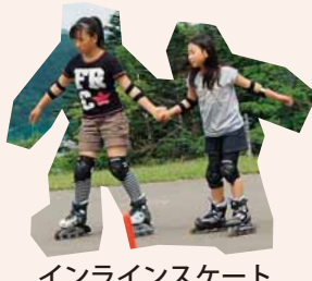
インラインスケート