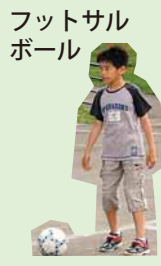
フットサルボール