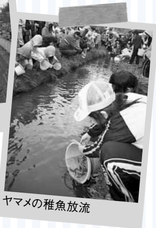
ヤマメの稚魚放流