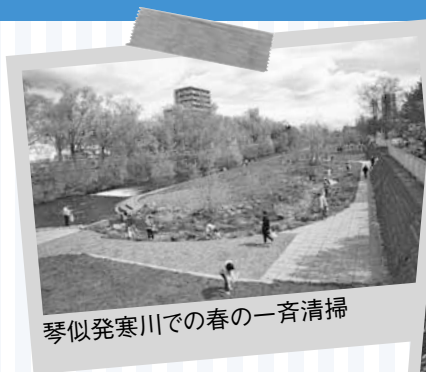
琴似発寒川での春の一斉清掃

琴似発寒川一斉清掃 毎年春と秋の2回、琴似発寒川と左股川の河川敷12キロの区間を清掃しています。区内すべての連合町内会を中心に、企業や学校も参加。例年、春秋合わせて3,000人以上が集まり、約2トンのごみを回収して川をきれいにしていきます。