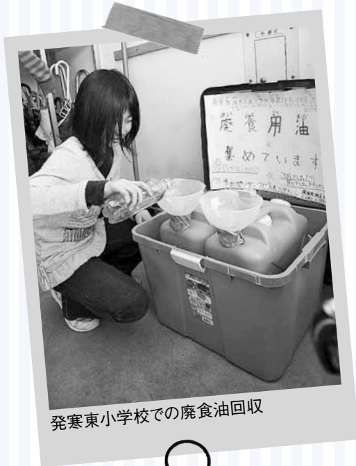
発寒東小学校での廃食油回収