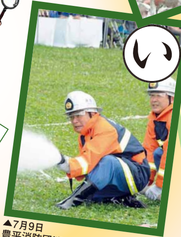
▲7月9日 豊平消防団消防総合訓練大会