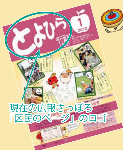
現在の広報さっぽろ「区民のページ」のロゴ