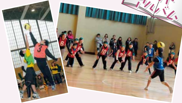
豊平区地区対抗青少年少女ドッジボール大会 (11/27) コートの中を所狭しと走り回り、ボールを投げたり捕ったりと熱戦を繰り広げました。