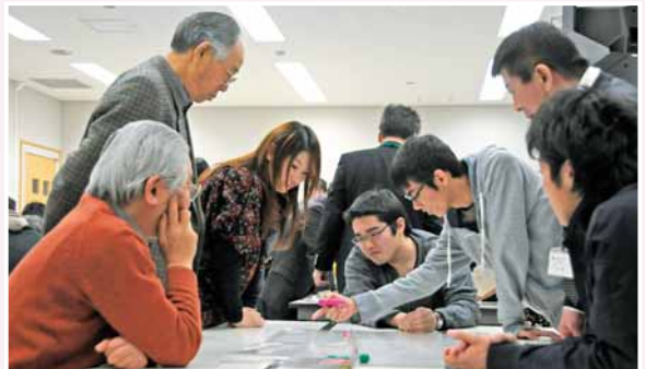
札幌大学と地域のDIG (災害図上訓練) (12/8) 大学生と地域住民が、地震や風水害などが起きた場合を想定し、対応を話し合いました。