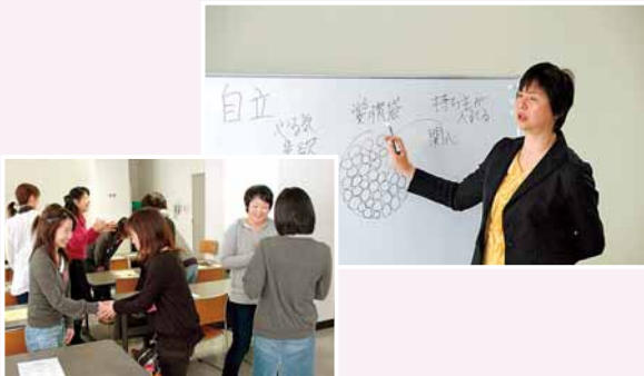
子育て講座「ママのための子育てコーチング」(12/8) 親子の信頼関係を築くためのコミュニケーションの取り方を、体験学習を通して学びました。