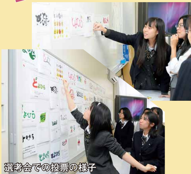
選考会での投票の様子