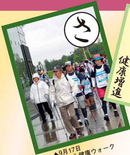
▲9月17日 とよひら健康ウォーク

豊平区役所総務企画課広聴係 〒062-8612 豊平区平岸6条10丁目 ☎822-2400 内線214・215 FAX 813-3603