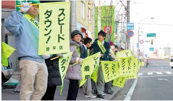
中の島合同交通安全街頭啓発 (11/24) 中の島中学校の生徒と地域住民が合同で、ドライバーに安全運転を呼び掛けました。