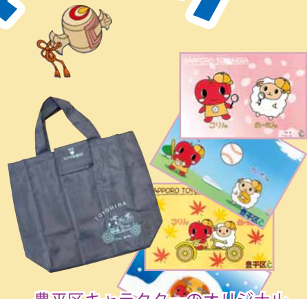
豊平区キャラクターのオリジナルポストカードとエコバッグをセットにしてプレゼントします！

お気に入りのデザインに投票してみませんか。投票していただいた方の中から、抽選で50人にプレゼントを差し上げます。