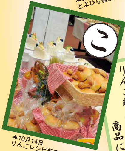
▲10月14日 りんごレシピ新商品発表会