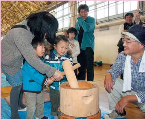
▲手稲鉄北まちづくり協議会主催の「餅つき大会」が稲陵中学校と手稲鉄北小学校で行われ、合わせて約900人が訪れました (11月19日、12月4日)。

人口140,199人 (前月比+81) 世帯数56,062世帯 (前月比+62) 平成23年12月1日現在