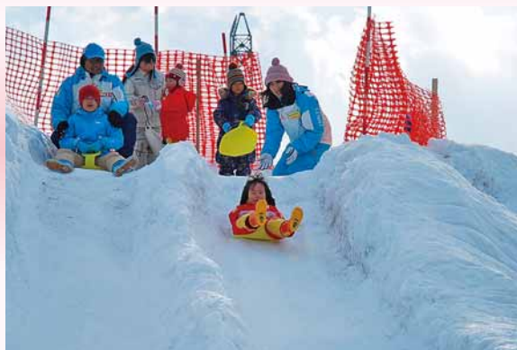
▲雪のすべり台で遊ぶ子どもたち