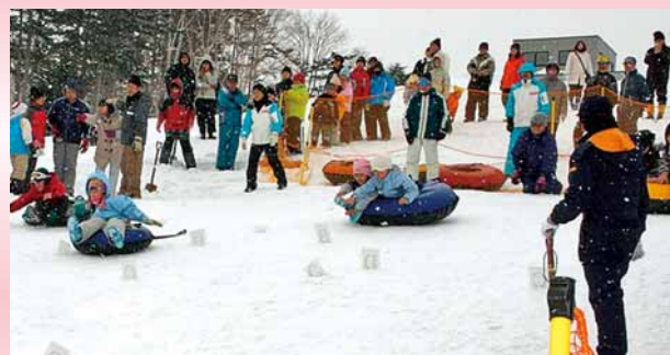
▲チューブすべりを楽しむ子どもたち