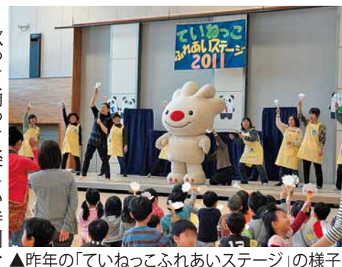
▲今年の「ていねっこふれあいステージ」の様子