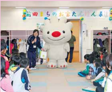
▲前田しらかば児童会館で「前田まちのお宝探検隊2011」が実施されました (11月19日)。