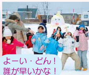
よーい・どん！ 誰が早いかな！