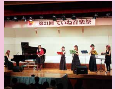
▲区民センターで「第21回ていね音楽祭」が開催され、21組162人が出演しました (12月4日)。