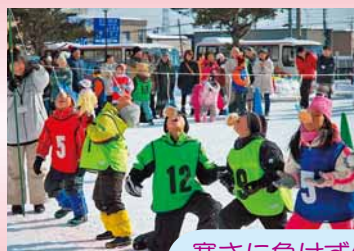
寒さに負けず外で遊ぼう♪ 寒くなってもホットな気分で♪