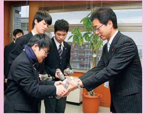
▲札幌稲穂高等支援学校の生徒から手稲区に凍結路面での転倒防止用の砂入りペットボトル1370本が贈られました (11月29日)。