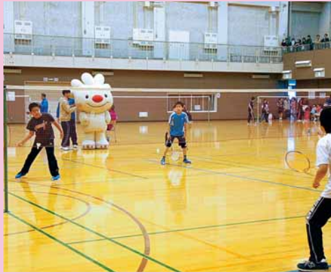
▲手稲区体育館で「手稲区小学生バドミントン大会」が開催され、手稲区、小樽市、石狩市の小学生114人が参加しました (11月23日)。