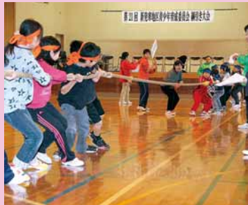
▲新発寒地区青少年育成委員会主催の「綱引き大会」が新陵小学校で開催されました (11月27日)。