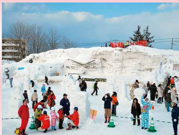
▲巨大雪像で遊ぶ子どもたち

これまで行われていた「手稲山雪の祭典」と「雪っていいね・ていね」が一体的なイベントとしてリニューアルします(主催:ていね雪の祭典実施委員会)。