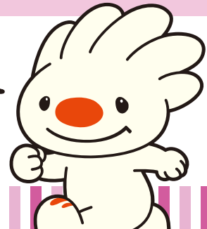
手稲区マスコットキャラクター ていね

編集手稲区役所総務企画課広報係 〒006-8612 札幌市手稲区前田1条11丁目 Tel:681-2400 (内線224) Fax:681-6639 ホームページ「ていねっていいね」 http://www.city.sapporo.jp/teine/