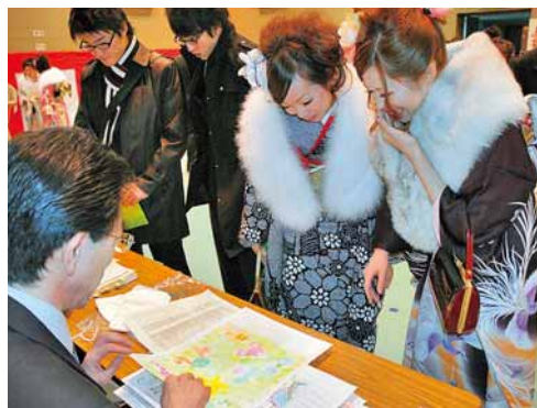
▲平成23年「小学生の夢返還コーナー」の様子