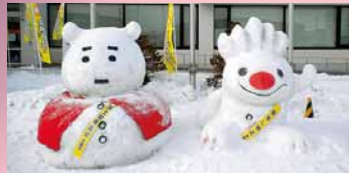
◀「ゆきだるマン」と「ていぬ」