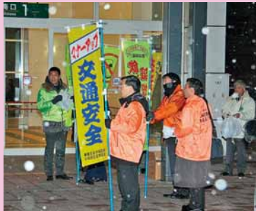
▲飲酒運転根絶キャンペーンが手稲駅南口周辺と手稲本町飲食店街で実施されました (11月22日)。