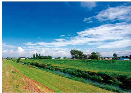
「夏の米里川緑地」 でんぼう たけし 伝法毅さん（中央区） 撮影場所：望月寒川・米里川緑地

〈講評〉----- 深紅の鳥居を走り抜ける少女。ブレが、いかにも決定的瞬間を捉えているという印象を与える、写真ならではの効果を使った作品です。赤とブルーの組み合わせもなかなか。グッドタイミングでしたね。