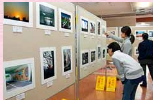
▲一次審査では全作品を展示

その後、最終審査として、11月15日に審査員5人による審査会を開催。厳正な審査の結果、最優秀賞1点、優秀賞3点、特別賞6点の10点が入賞作品として選ばれました。