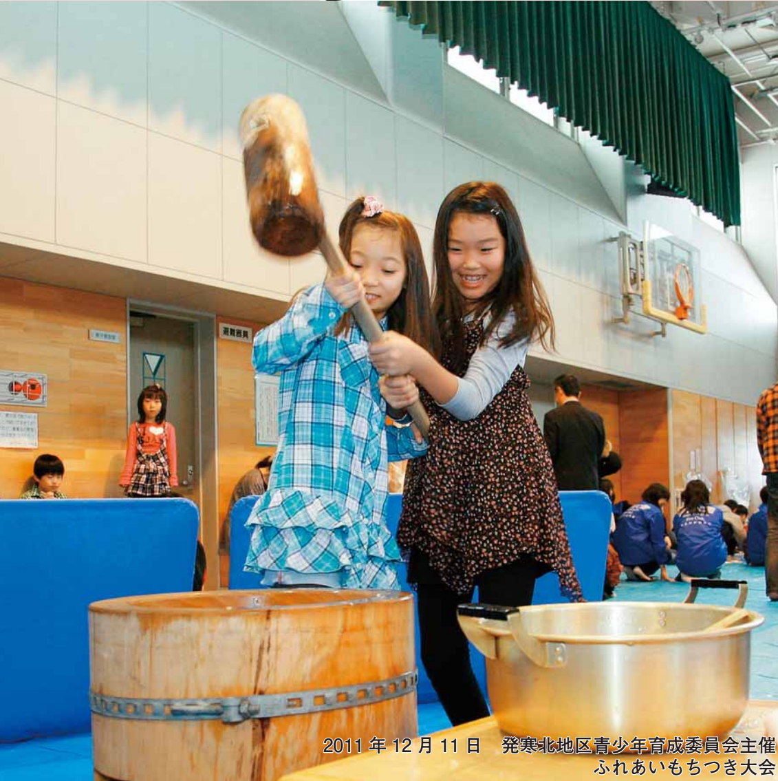
2011年12月11日 発寒北地区青少年育成委員会主催 ふれあいもちつき大会