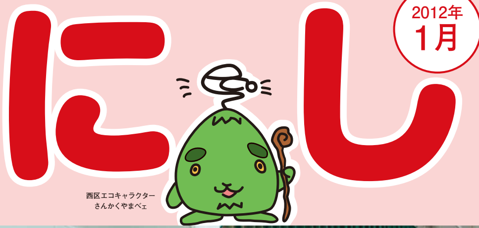
西区エコキャラクター さんかくやまべエ

区民のページで取り上げてほしいテーマなど、 皆さんからのご希望やご意見をお寄せください。 はがき、ファクス、Eメール nishi@city.sapporo.jp で 西区総務企画課広聴係へ。