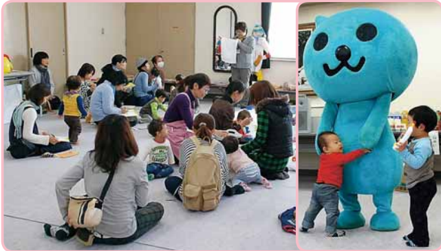
▲タオルも遊び道具のひとつ

宮の森まちづくりセンター（宮の森2-11）において「子育てサロン in 宮の森まちセン！」が初めて開催され、地域の親子連れが「快適な冬の暮らし方、遊び方」講座を聞いたり、おもちゃで遊んだりしました。同世代の子を持つ親たちは、子育てについての情報交換をしたり、バザーの冬物衣料を選ぶなどリラックスして過ごしました。