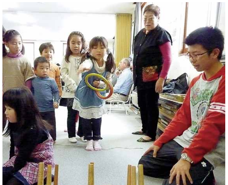
◀▲南円山地区「ふれあいもちつき・昔あそび交流会」 (平成23年12月4日：南円山会館)