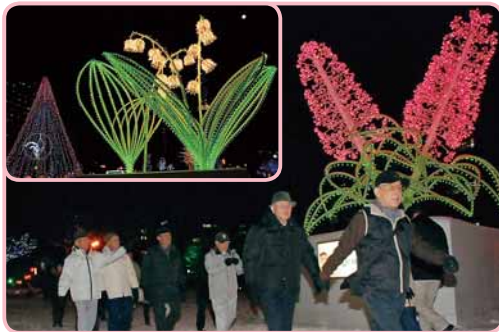
▲後ろ髪を引かれる思いで先へ