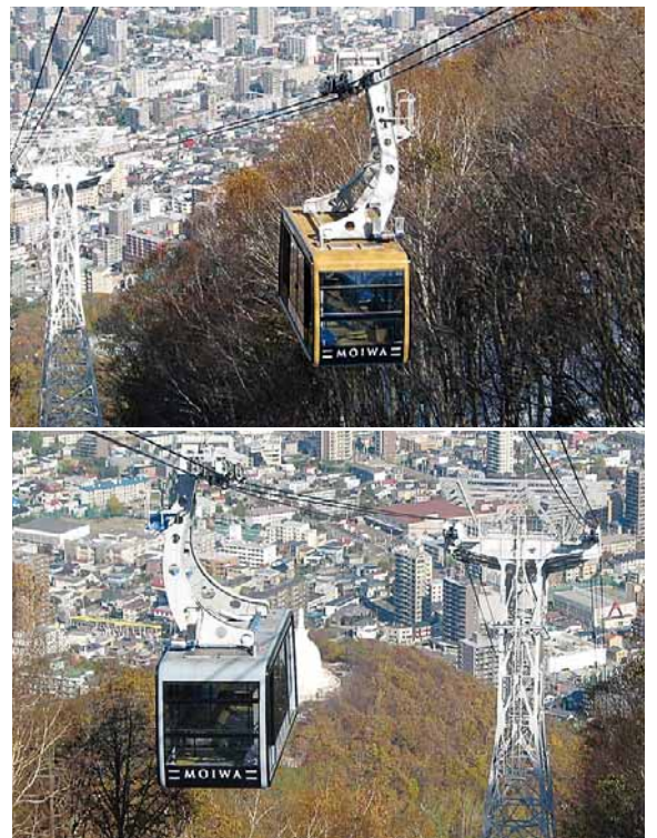
▲東側ロープウェイ(上)と西側ロープウェイ