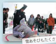
雪あそびもたくさん