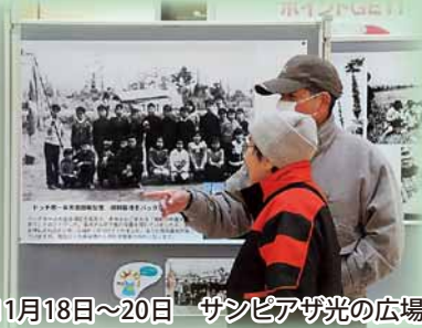
11月18日～20日 サンピアザ光の広場

厚別区にゆかりのある人物や昔の街並み、古地図など52枚のパネルを展示。明治から昭和への歩みが紹介されました。