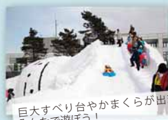
巨大すべり台やかまくらが出現。みんなで遊ぼう！