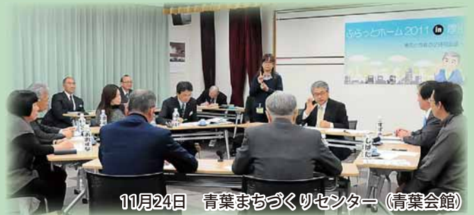
11月24日 青葉まちづくりセンター（青葉会館）

子どもや女性への安全対策、障がい者の就学・雇用など市政に関する素朴な疑問や提案について、自身の経験談も交えて話し合われました。