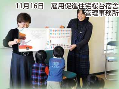
11月16日 雇用促進住宅桜台宿舎管理事務所

演奏と朗読で東日本大震災の避難者を元気づけようとボランティア団体が実施。読み聞かせでは、子どもたちが、絵本にくぎ付けになりました。