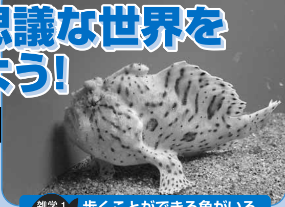
雑学1 歩くことができる魚がいる

常識とは違う、驚きの生態を持つ魚たちを集めた企画展を開催中です。その一部を紹介します。