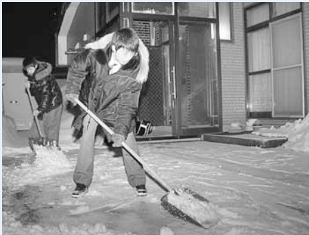
除雪に必要な用具は、生徒たちが育てたジャガイモをバザーで販売し、その収益で購入しました。

取り組み初年度の昨シーズンは、19人の生徒が自発的に参加し、5世帯を対象に活動。延べ出勤回数は272回、一番多い生徒では26回に上りました。