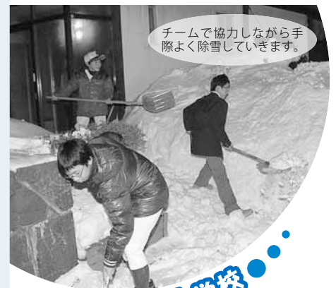
チームで協力しながら手際よく除雪していきます。