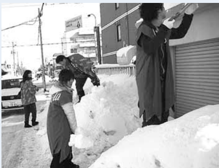
グループ別に各家庭を訪問し、家主の要望を聞きながら作業を進めました。

家主から差し入れを受けるなど和やかに交流を深める場面も見られ、目的の一つである「顔の見える地域づくり」を実現しています。