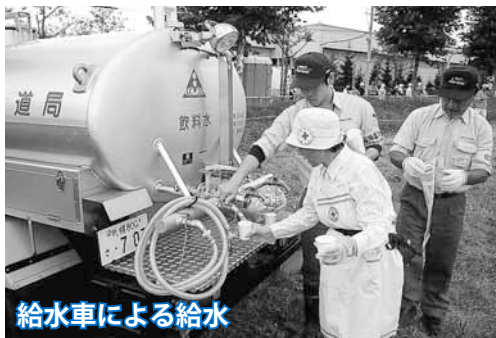
給水車による給水

札幌市と防災関係機関および地域住民の連携のもと、「災害に強いまちづくり」と「防災協働型社会の実現」の推進を目的とした災害対応訓練が行われます。 (※写真は昨年の総合防災訓練のものです。)