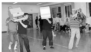
↑獅子頭の持ち方を指導

少年期は獅子取りとして活躍。現在は獅子頭振りのリーダーとして舞を盛り上げるほか、後進の育成にも力を入れています。