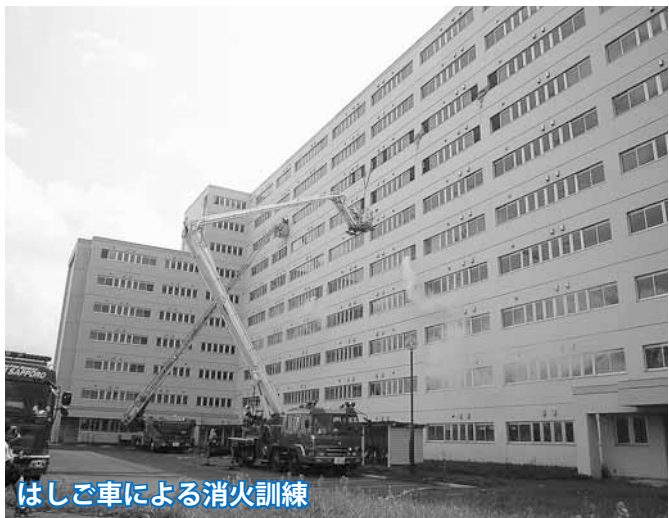
はしご車による消火訓練

札幌市と防災関係機関および地域住民の連携のもと、「災害に強いまちづくり」と「防災協働型社会の実現」の推進を目的とした災害対応訓練が行われます。 (※写真は昨年の総合防災訓練のものです。)