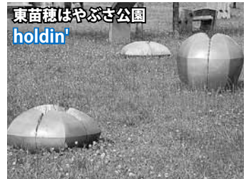
所在：東苗穂12条1丁目

札苗地区の住宅街にある公園に、珍しい彫刻作品があります。 これは、東区の区制25周年などを記念して、平成9年に北海道で活躍している彫刻家によって制作されました。原材料はアルミ缶をリサイクルしたアルミニウムです。 小さな野外彫刻を見ながら散策するのはいかがですか？