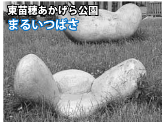
所在：東苗穂8条1丁目

「札幌市民憲章」は皆さんご存知かと思いますが、札苗地区にもオリジナル憲章があるんです。 これは、平成3年に札苗地区開基100年を記念し、札苗連合町内会が制定しました。 この憲章プレートは、モエレ交流センターなどの町内会館に掲示されています。