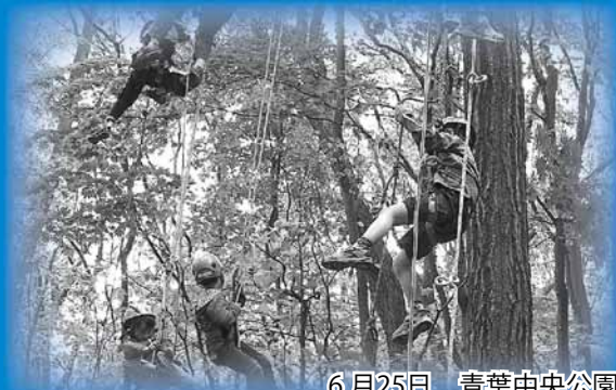
6月25日 青葉中央公園