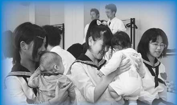
6月24日 札幌啓成高等学校

生徒たちは、抱っこしたり、おもちゃで 一緒に遊んだりして、赤ちゃんに触れいま した。親子の愛情の深さを知り、自分の保護者 に対する感謝の心や命の素晴らしさを学び ました。