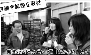
発寒北地区のパン工場「おかめや」にて

冊子に掲載する店舗や施設など約30か所を大学生記者が分担して取材。店主への取材や写真撮影などを自ら行い、西区の知られざる新たな魅力を発見しました。