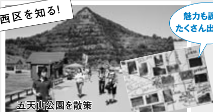
五天山公園を散策