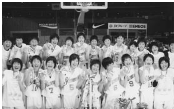
■昨年12月28日、全国高校選抜優勝大会での優勝を決め、チームで記念撮影。