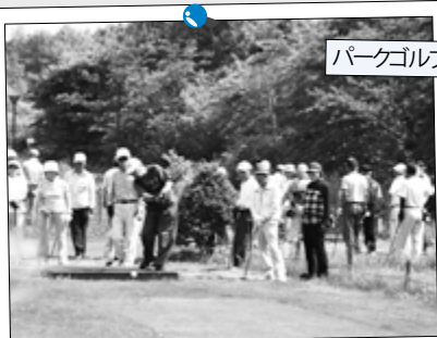
パークゴルフ大会