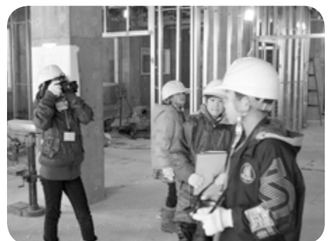
建設中の「ちあふる」内部も取材しました

ただき、いろいろ工夫している点がありました。また、音やほこりが近所の迷惑にならないようにシートで囲んだり「KY（危険予知）活動」に取り組んだり、常に安全に気を配っている点も印象的でした。