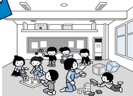
ミニ児童会館 (イメージ)