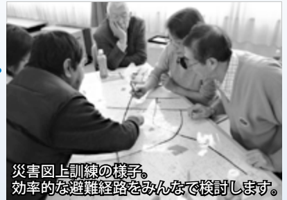
災害図上訓練の様子。効率的な避難経路をみんなで検討します。

苗穂地区では、地域で生活するお年寄りや障がいのある方の状況を事前に把握し、災害時の避難支援などに役立てる取り組みを行っています。災害発生の際、迅速に安否確認や避難の手伝いなどができるよう、図上訓練を実施しているほか、日常的に災害に関する啓発活動や安心安全見守りパトロールも続けています。