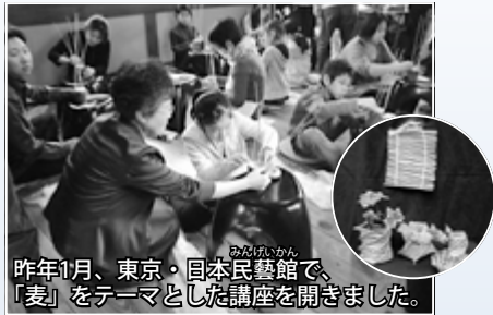
昨年1月、東京・日本民藝館で、「麦」をテーマとした講座を開きました。

次の世代を担う子どもたちに東区の風土や文化を伝えようと、ワークショップ（体験型講座）などを通じ、約40年の長きに渡って熱心な活動を続けています。近年は北海道産の麦わらを使用した工芸品制作に力を入れており、素朴かつ繊細なその作品は、見る人の心を魅了します。