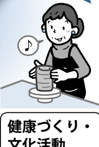
健康づくり・文化活動