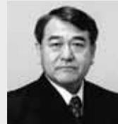
↑札幌旭丘高校出身の経済評論家・寺島美郎さんが講演

寺島氏の講演や食に関するパネルディスカッションを実施。 日時 2/25(金)午後3時~5時50分 会場・定員 共済ホール(中央区北4西1)。600人 申込 はがき、ファクス、Eメール。住所、氏名、電話番号を記入し、2/18(金)(必着)までに産業振興財団(〒003-0005白石区東札幌5の1、FAX815-9321、Eportal@sec.or.jp)へ。多数時抽選。申し込みはホームページ www.sec.or.jp/simple/keizai からも可 [詳細] 産業振興財団 ☎820-2062