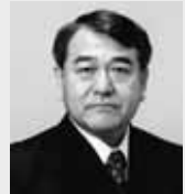
↑札幌旭丘高校出身の経済評論家・寺島美郎さんが講演

寺島氏の講演や食に関するパネルディスカッションを実施。 日時 2/25(金)午後3時~5時50分 会場・定員 共済ホール(中央区北4西1)。600人 申込 はがき、ファクス、Eメール。住所、氏名、電話番号を記入し、2/18(金)(必着)までに産業振興財団(〒003-0005白石区東札幌5の1、FAX815-9321、Eportal@sec.or.jp)へ。多数時抽選。申し込みはホームページ www.sec.or.jp/simple/keizai からも可 [詳細] 産業振興財団 ☎820-2062