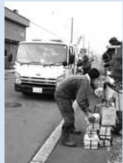
決められた場所に置かれた段ボール、新聞、雑誌などを回収業者が引き取ります

町内会、PTA、マンション管理組合などが、地域内の古紙を回収業者に売り払う取り組みです。地域内にお住まいであればどなたでも出すことができます。