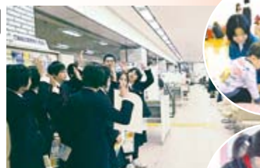
▲手稲、前田、稲穂中学校の生徒が区役所で職場体験を実施。児童会館も訪問しました。