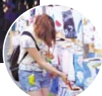
▲ちょうちんに灯をともし参加者。