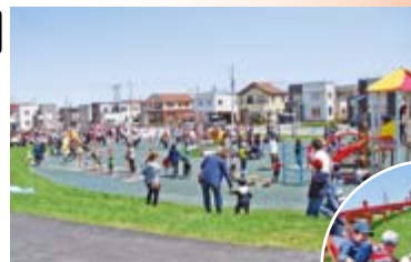
▲明日風公園が完成。親子連れで大にぎわい。