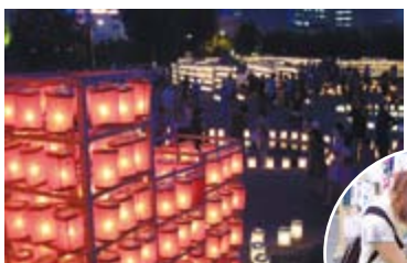
▲「ていね夏あかり」は手稲の夏の風物詩です。