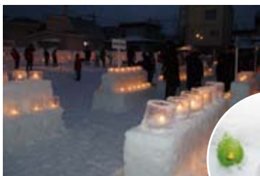
▲「アイスクャンドル大作戦in西宮の沢」開催。