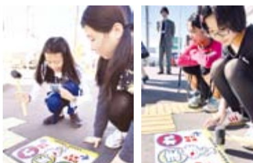
▲手稲鉄北小学校の児童が「ていぬ」の「ストップマーク」を張りました。