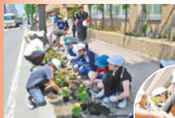
▲手稲鉄北小学校の児童が通学路に花を植えました。