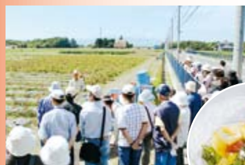
▲「地産地消による北海道型食生活バス研修会」開催。