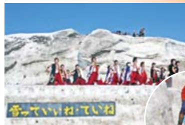
▲「雪っていいね・ていね」がてっぽく・ひろばで開催。