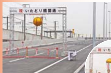
▲鉄工団地通の新発寒前田間にいたどり橋完成。