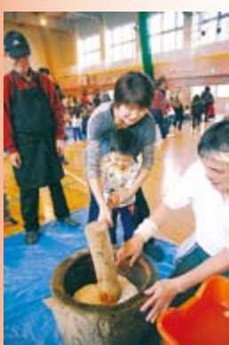
▲手稲鉄北小学校で「もちつき大会」開催。