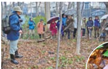
▲雨天の中、稲穂ひだまり公園で「自然観察会」開催。