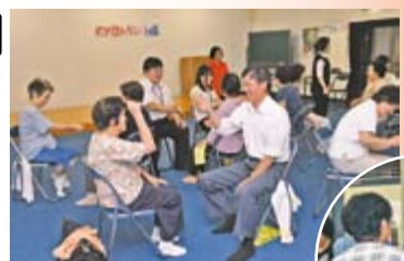
▲出張介護予防教室「おでかけ元気キャラバン」。