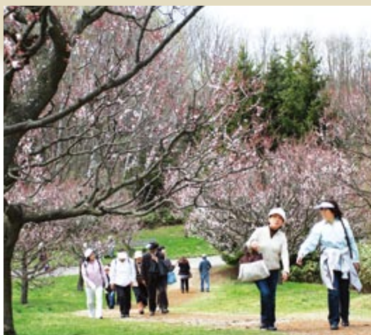
5月 健康行楽弁当&ウォーキング

お弁当を作り、平岡公園を目指してウォーキング。美しい梅林を眺めながら味わいました。