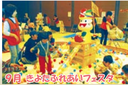
9月 きよたふれあいフェスタ