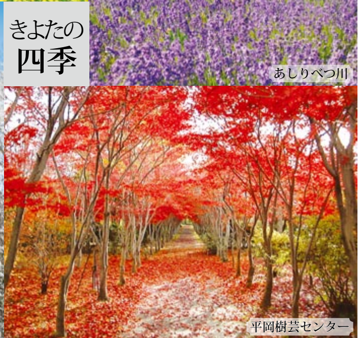
平岡樹芸センター