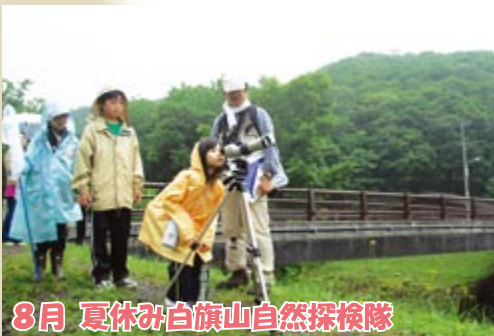
8月 夏休み白旗山自然探検隊