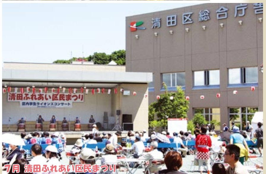
7月 清田ふれあい区民まつり

ステージ発表やゲーム大会、スタンプラリーなど盛りだくさんのイベントで、約2万6千人が祭りを楽しみました。