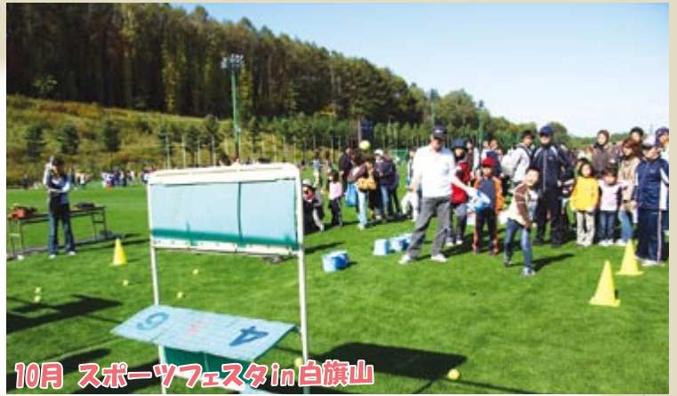
10月 スポーツフェスタin白旗山

秋晴れの下、約3千人がストラックアウトや野球教室などで、スポーツの秋を満喫しました。