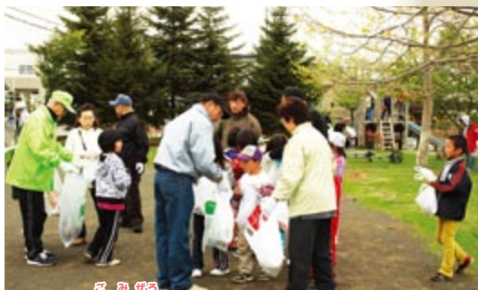
5月 「530の日」クリーン大作戦