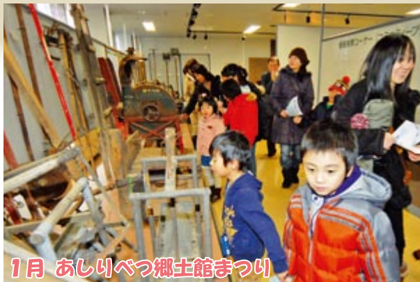
1月 あしりべつ郷土館まつり