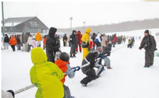
2月 白旗山ウインタースポーツトライアル