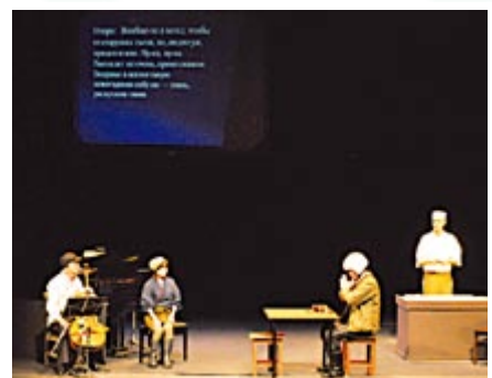
秋のソナチネ (2010年9月 サハリン公演)

日 1月14日(金)～20日(木)。 所 区役所1階 正面ロビー。 【詳細】健康・子ども課生活衛生 担当 ☎(889)2400 内線501