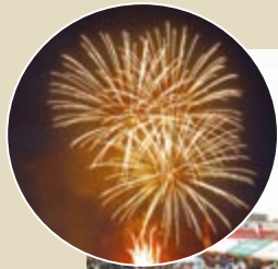
7月 北野ふれあい夏まつり