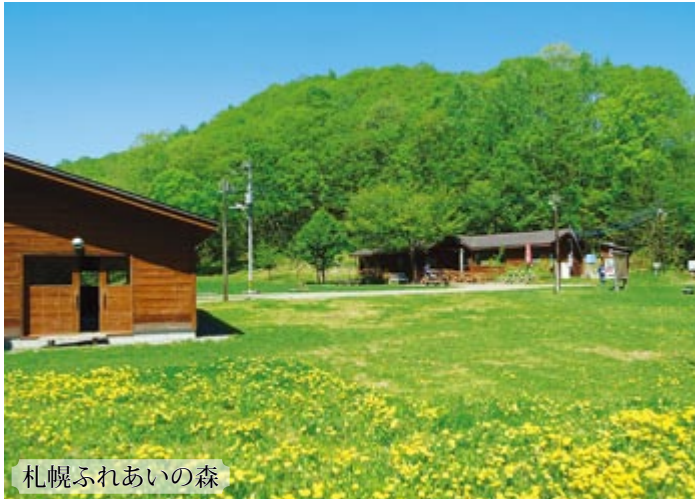
札幌ふれあいの森

清田区のホームページ「きよたファン倶楽部」 http://www.city.sapporo.jp/kiyota/