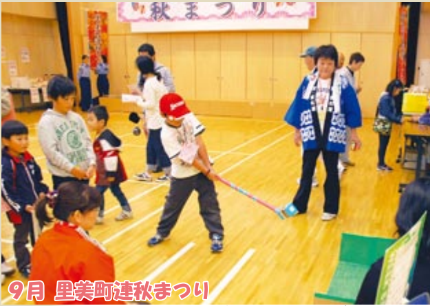
9月 里美町連秋まつり