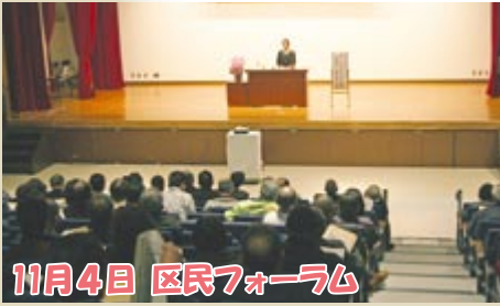
11月4日 区民フォーラム

秋晴れの下、約3千人がストラックアウトや野球教室などで、スポーツの秋を満喫しました。