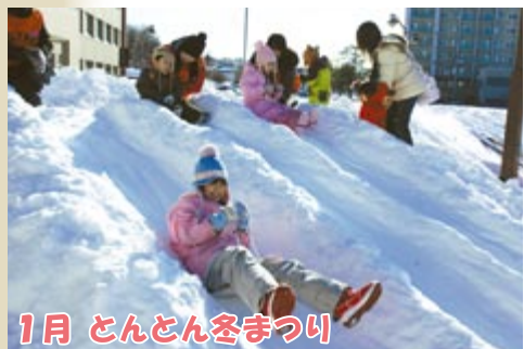
1月 とんとん冬まつり