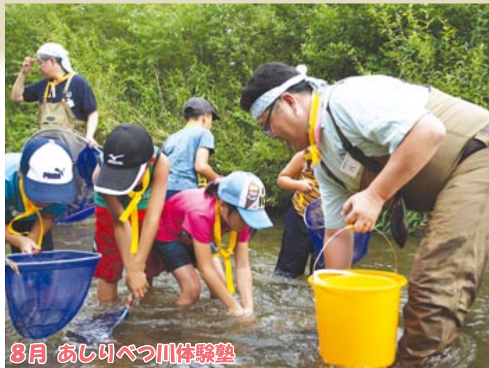
8月 あしりべつ川体験塾