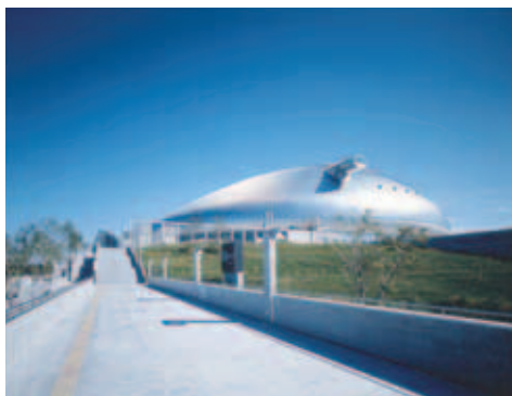
開業10周年を迎えた札幌ドーム。今後、電光掲示板など、設備の更新や改修が必要となる