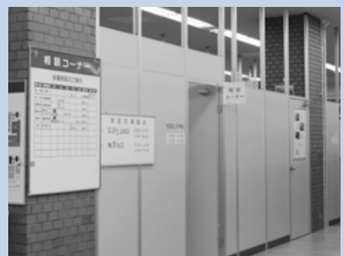
◀正面玄関から入って左手前方です

◇南区役所1階相談コーナーでは、以下のような相談も行っています。※法律相談のみ、予約が必要です。