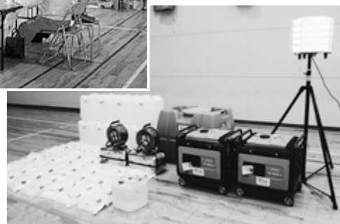
▶新たに購入した機材

◎今年度、宝くじの事業収入を財源としたコミュニティ助成事業助成金を受けて、照明や暖房、水を確保するための機材を購入しました