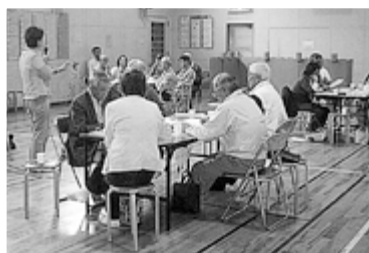
◀災害図上訓練 (DIG)の様子

「札幌でも、いつ大地震などの災害が起きるかわかりません。日ごろから、防災に対する意識を持ち、訓練などには積極的に参加してほしいです」と熱心に呼び掛けていました。