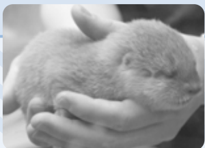
▲毛が短く茶色っぽい赤ちゃんカワウソ