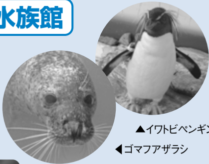
▲イワトビペンギン

海や川にすむ約150種の生き物を間近で観察できる水族館。魚やカワウソなどの生き物たちと、直接触れ合うことができるイベントが人気です。