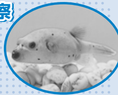
▲硬い歯を持つ コクテンフグ

しま模様や斑点など、種類によって異なる皮ふの模様を比べてみよう! 口の中をのぞくと、4枚の鋭い歯も見られます。