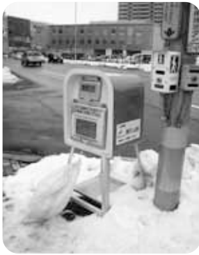
凍結路面対策の歩行者用砂箱

母子健康手帳表紙デザイン案の市民投票 母子健康手帳の表紙デザインへの応募作品を展示し、市民投票を行います。投票結果を踏まえ、最終審査で来年度からの表紙を決定します。 10月22日(金)~27日(水)午前8時~午後9時。 【所】 北洋大通センター(中央区大通西3)。