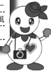
マスコットキャラクター 「しろっぴー」