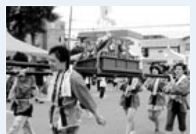
▲子どもみこし (子ども遊芽カーニバル)