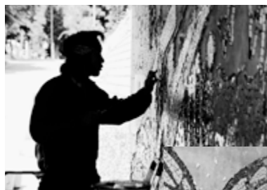
プロの仕事の間近で感じる。