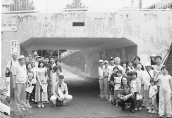
平成22年8月8日の完成式には多くの人に参加。みんな笑顔で完成を祝い、これまでの努力を互いにたたえ合った。