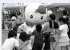
▲子どもに大人気！「しろっぴー」