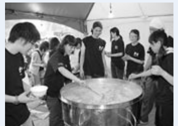
▲しろいし大鍋 (若者プロジェクト)