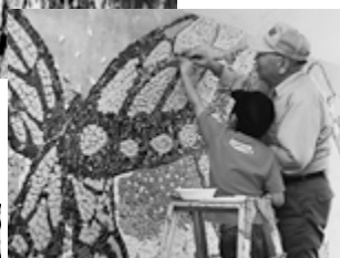
年齢に関係なく協力する姿は毎日見られる風景。