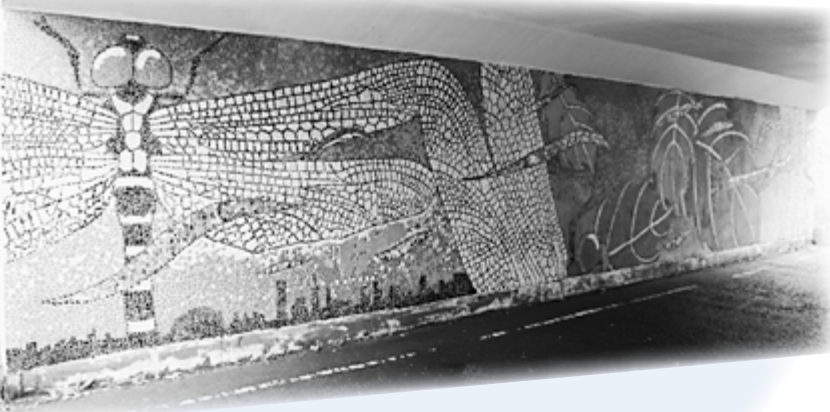
「とんぼそして幸せの七つ星」 (平成21年10月完成) カラマツトンネル内南側壁面。 昨年、延べ555人が制作に参加。