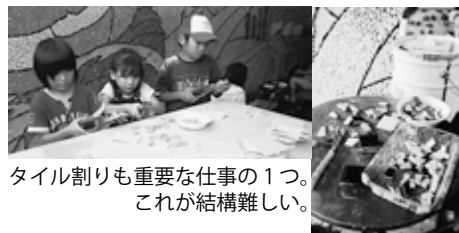
タイル割りも重要な仕事の1つ。 これが結構難しい。