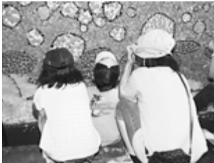
何年たっても親子3人でタイルを張ったこの場所は忘れない。

色鮮やかな赤いバラが咲き、チョウが空を舞う。赤ツメ草の群生にたたずむカエルが、虹の懸け橋を見つめる。機関車や虫捕りに出掛ける家族の様子など昔懐かしい白石の原風景。そして、そのすべてを女性の柔らかなまなざしが包み込む。