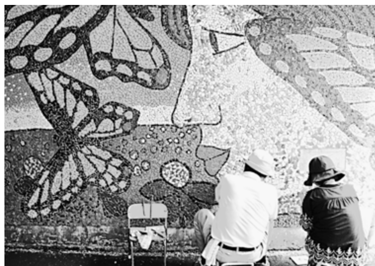
モザイクアート…大理石・ガラスなどの小片(ピース)を組み合わせて配置し、絵や模様を描く美術・建築装飾技法の1つ。