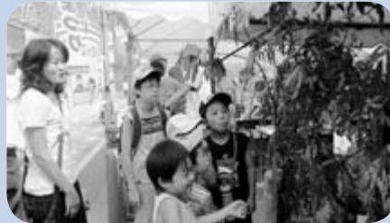
▲すみかわ七夕まつり