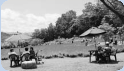
▲南沢ラベンダーまつり