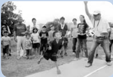
▲八剣山さくらんぼ祭り