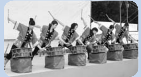
▲藤野ふるさとまつり