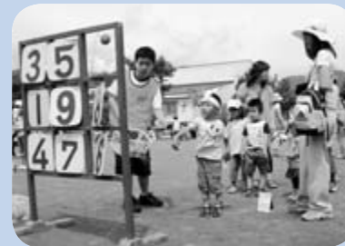
▲夏だ！みなみくんまつり▲