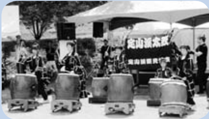
▲定山溪温泉かっぱウイーク