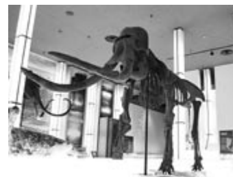
ナウマンゾウの骨格標本

北海道立の総合歴史博物館。120万年前から昭和までの北海道の自然や歴史、文化を8つのテーマで展示しています。