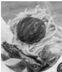
↑旬の素材を生かしたスイーツ