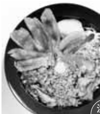
↑十勝産牛肉じゃらん丼