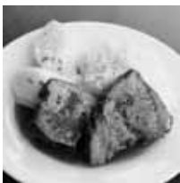
↑道産ポークの赤ワイン煮