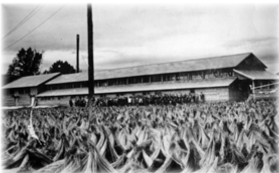
昭和18年ころの帝国製麻琴似製線工場

昭和32年に帝国製麻琴似製線工場が閉鎖、跡地の宅地化が決まると、住民らは工場ゆかりの「麻」を町名として後世に残そうと奔走しました。この思いが実を結び、昭和34年4月「麻生町」が誕生、現在まで発展を続けています。