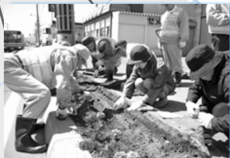
「アマ・ロード」をつくる内外太平町内会の皆さん④