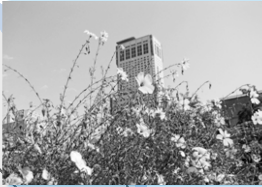
北海道教育大札幌校 ● 北8条通を彩る亜麻の花①

北区では、明治から昭和の中ごろまで、現在の麻生町で製麻工場が操業、原料となる亜麻の栽培を含め、亜麻産業が栄えていました。 今月は、当時をしのばせる亜麻の花でまちを飾ろうと、北区が進める「亜麻のフラワーロード事業」に取り組んでいる地域を紹介します。