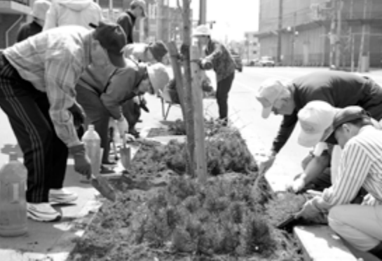
新琴似駅前も亜麻でいっぱいになります③