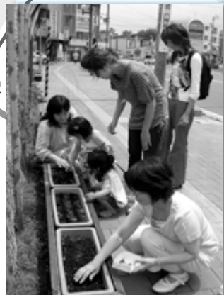
麻生地区で亜麻の種を植える親子②