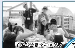
子ども会夏季キャンプ

子ども会は、楽しい体験ができるんだね。 新しいお友だちもできそうだよ。 興味を持ったら参加してみよう！