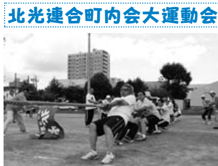
7月4日 美香保小学校