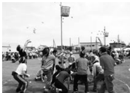
丘珠連合町内会大運動会