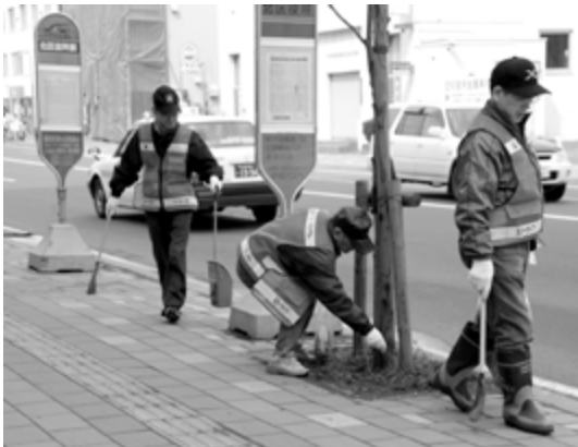
アダプトベストを着用して活動します