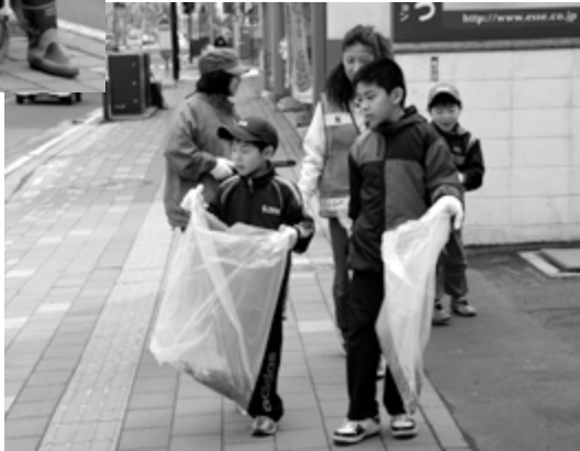
通学路もきれいになりました

ごみが落ちていない道路や街並みは、とても気持ちがいいものです。「自分たちの住むまちをきれいにしよう」という思いは、地域への愛着へとつながります。 今月は、きれいで住みよいまちづくりを目指す団体が、北区が取り組む「アダプト・プログラム事業」に参加し、活動する様子を紹介します。