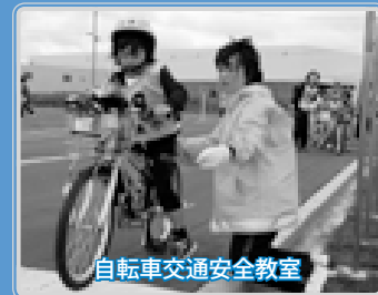
自転車交通安全教室