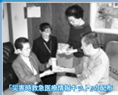
「災害時救急医療情報キット」の配布