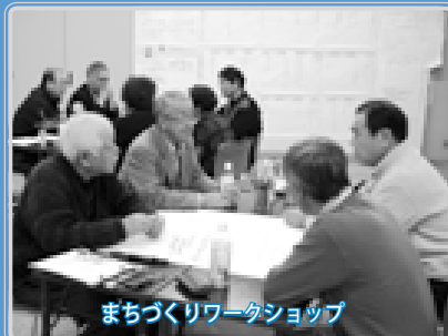
まちづくりワークショップ

掲載写真は、本プランで実施予定の事業のほか、区が支援する地域の取り組みの一部を紹介しています。