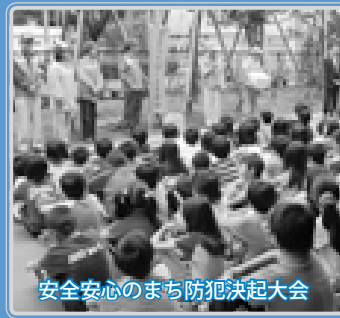
安全安心のまち防犯決起大会