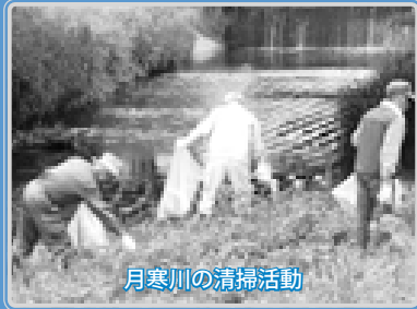
月寒川の清掃活動

白石区では、その具体化に向けて、区民の皆さんと連携してまちづくりを進めるため、平成22年度の「白石区実施プラン」を策定しました。今月の特集では、このプランの概要を紹介します。