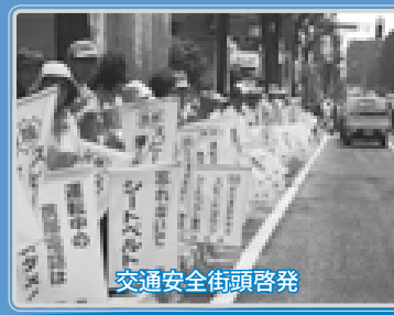
交通安全街頭啓発