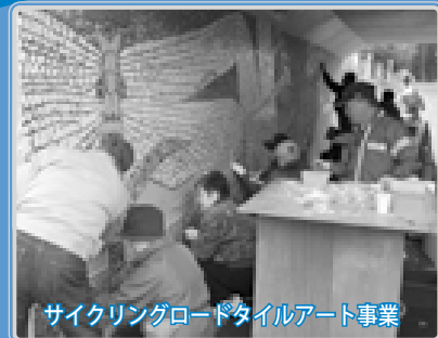
サイクリングロードタイルアート事業