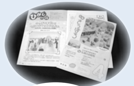
広報さっぽろ東区版